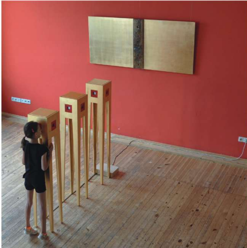
WOAK Białystok 2016r.