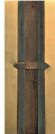
9RE2015 drewno, MDF, szlagmetal 50 x 120 cm