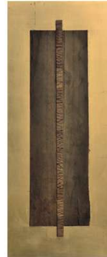
1RE2015 drewno, MDF, szlagmetal 50 x 120 cm