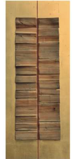
7RE2015 drewno, MDF, szlagmetal 50 x 120 cm